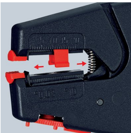
12 40 200: namjestiv graničnik duljine

Zadržano pravo na tehničke izmjene i zabune