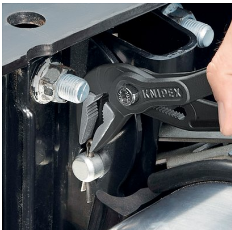
Optimalna pristupačnost radnom komadu. Idealna za servis i održavanje, paraturu, automobilsko područje i industriju